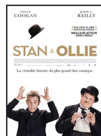
STAN & OLLIE 20h30