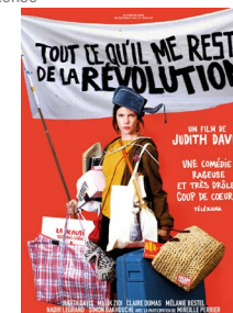
TOUT CE QU'IL ME RESTE DE LA RÉVOLUTION 20h30