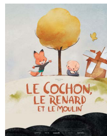
LE COCHON, LE RENARD ET LE MOULIN 17h30

Cinéma - Salle de spectacle et de cinéma d'Aime avec 73210Zimages Plein Tarif 5,50€ - Tarif Réduit ou Adhérent 4,50€ - moins de 14 ans 3,50€