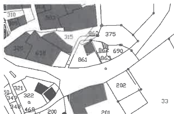
Extrait du précédent cadastre

La délimitation de la zone Uc va être recalée à la limite de la route sur les parcelles 921, 920 et 863. Ce décalage agrandit la zone Uc de 58 m 2 .